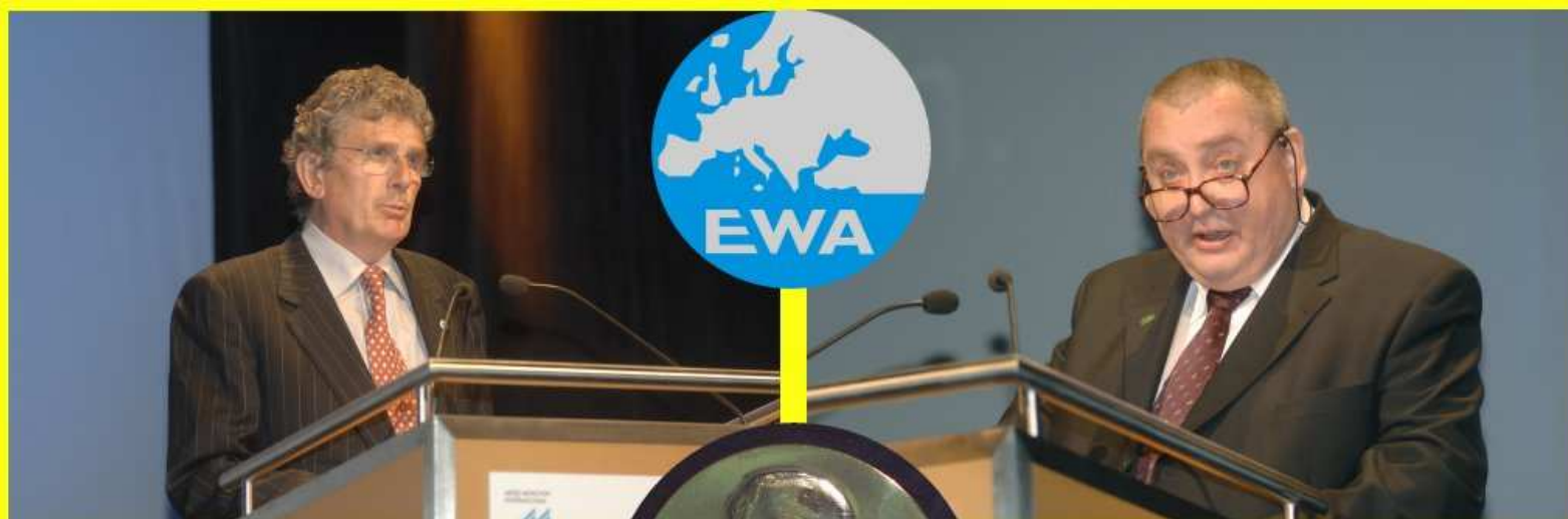
Laudatio, President EWA Cook Munich, 4 May 2008